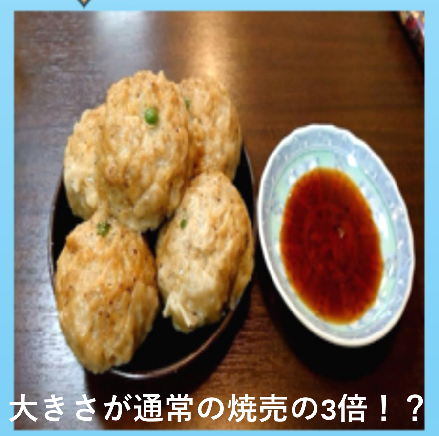
大きさが通常の焼売の3倍！？