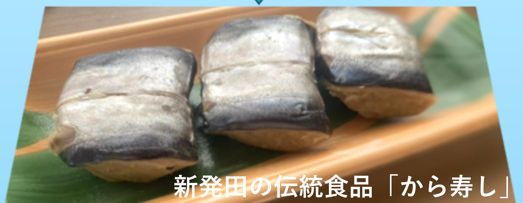
新発田の伝統食品「から寿司」